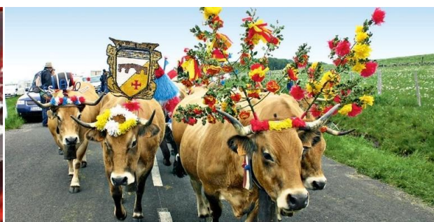
Fête de la Transhumance à Aubrac