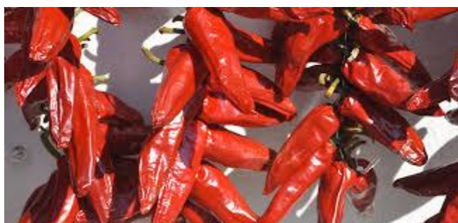
Fête du Piment, Espelette